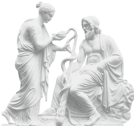
Рельеф с Гигией и Асклепием, John G. Unnevehr, 1872 г. Музей Гетти, Лос-Анджелес, США