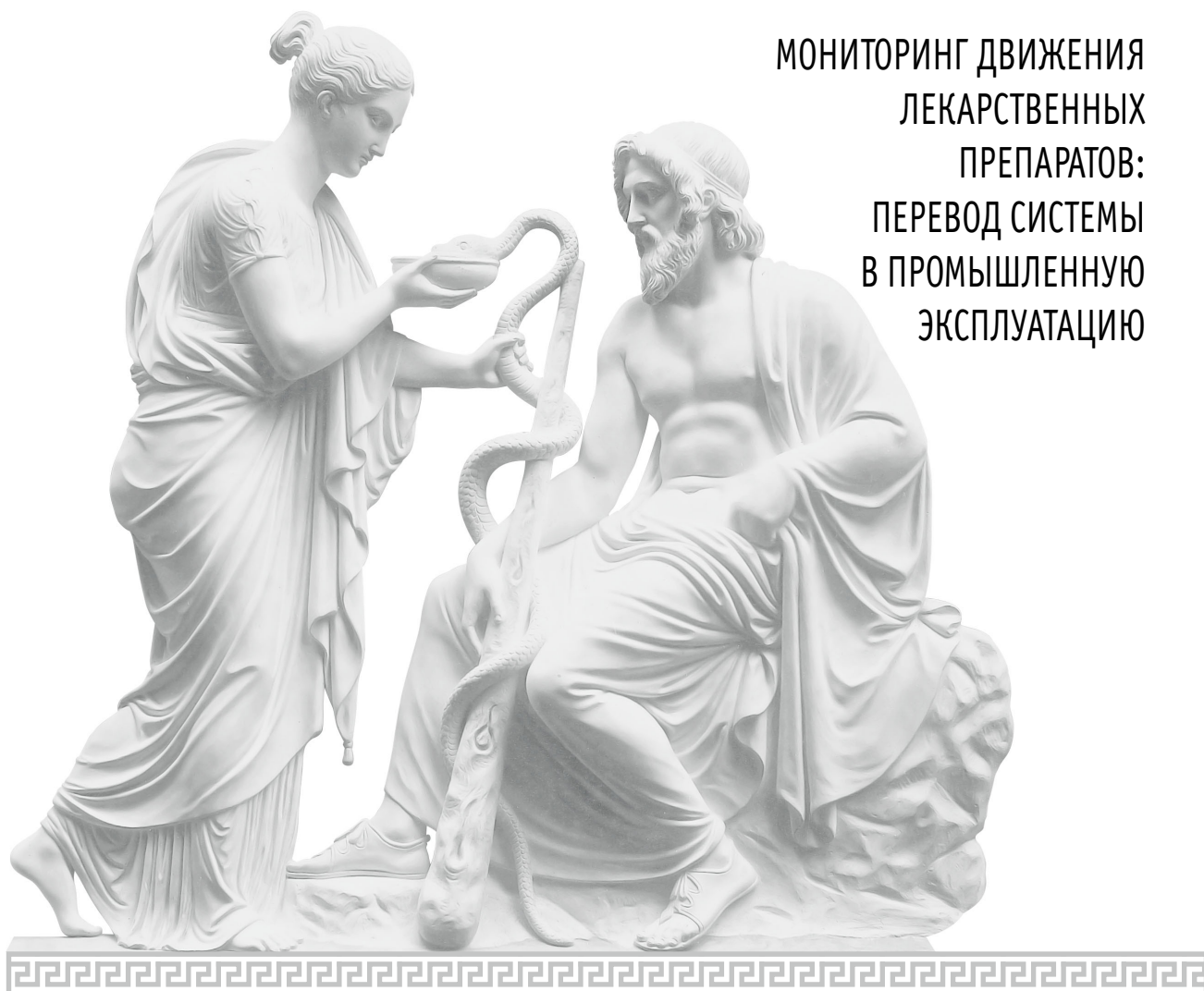
Рельеф с Гигиеей и Асклепием, John G. Unnevehr, 1872 г. Музей Гетти, Лос-Анджелес, США

МОНИТОРИНГ ДВИЖЕНИЯ ЛЕКАРСТВЕННЫХ ПРЕПАРАТОВ: ПЕРЕВОД СИСТЕМЫ В ПРОМЫШЛЕННУЮ ЭКСПЛУАТАЦИЮ